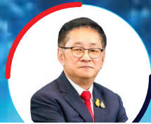
Mr. Prasert Jantararungtong Deputy Prime Ministers Minister of Digital Economy and Society