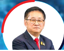
คุณประเสริฐ จันทรวงทอง รองนายกรัฐมนตรี รัฐมนตรีว่าการกระทรวง ดิจิทัลเพื่อเศรษฐกิจและสังคม